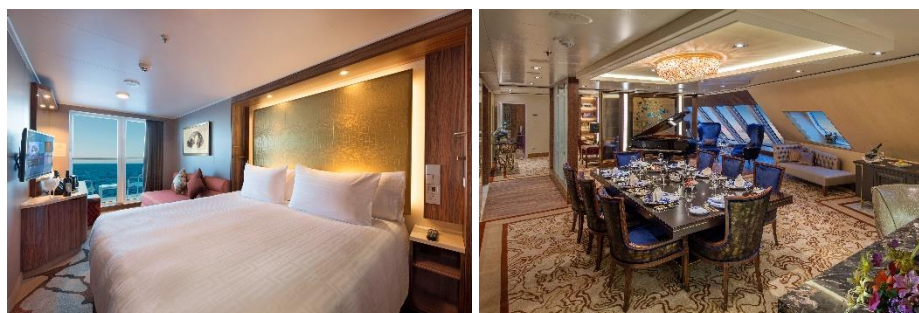
「豪华邮轮海上行宫大抽奖」奖品包括「云顶梦号」豪华海景露台客房(左)年度邮轮通行证及入住皇宫庭苑别墅(右)的三日两夜邮轮假期。

星梦邮轮「豪华邮轮海上行宫大抽奖」将开放予所有于 7 月 30 日或之前在香港完成两剂新冠疫苗接种及年满 18 岁的香港市民*，报名日期为 6 月 10 日至 7 月 30 日。市民可免费参加抽奖，无须作出任何消费。