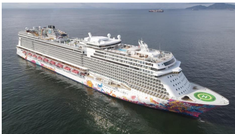
「云顶梦号」今晨 8 时进入香港水域，目前停泊在南丫岛以南

2021 年 6 月 9 日，香港 – 星梦邮轮「云顶梦号」今晨 8 时进入香港水域，目前停泊在南丫岛以南检疫隔离，为 7 月 30 日首航的「夏日海上游」启航做好准备。