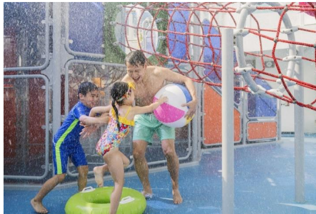
「雲頂夢號」設有兒童水上樂園

星夢郵輪的 15 萬噸巨輪「雲頂夢號」可載客 3,300 人(下舖床位)，獲郵輪業界權威指南《2020 伯利茲郵輪年鑑》評選為「世界十大最佳大型郵輪」，匯集適合一家大小的娛樂、美食及休閒活動與設施，為渴望出遊已久的香港市民締造非一般的 Super Summer Seacation 夏日海上假期，讓旅客投身在久違的陽光和海風中，享受真正出遊度假的感覺，非岸上假期可以媲美。