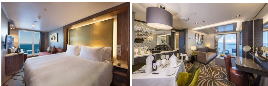
「云顶梦号」的海景露台客房及皇宫行政套房

面积超过 215 平方呎的海景露台客房附设宽阔露台，旅客可随时眺望无垠的大海，感受海洋假期的魅力。追求奢华体验的旅客，可选择入住星梦邮轮集豪华精品酒店与私人会所于一身的独特「船中豪华船」概念 - 「The Palace 皇宫」，尊享高级精致的餐饮、独家的增益活动和全包式礼遇，体验升华到至臻艺术境界的奢华邮轮假期。