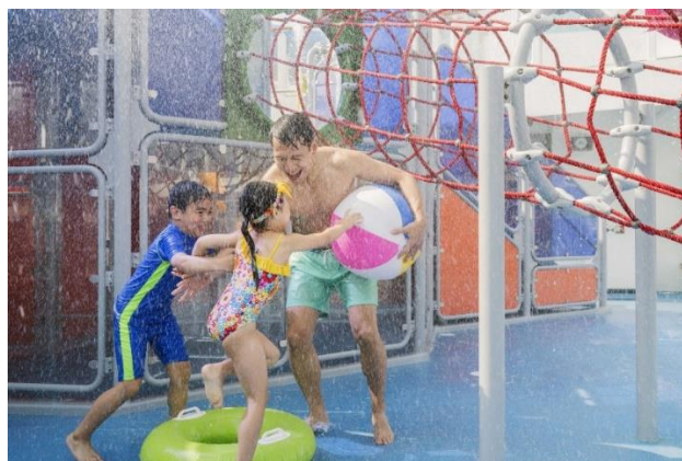
「云顶梦号」设有儿童水上乐园

星梦邮轮的 15 万吨巨轮「云顶梦号」可载客 3,300 人(下铺床位)，获邮轮业界权威指南《2020 伯利兹邮轮年鉴》评选为「世界十大最佳大型邮轮」，汇集适合一家大小的娱乐、美食及休闲活动与设施，为渴望出游已久的香港市民缔造非一般的 Super Summer Seacation 夏日海上假期，让旅客投身在久违的阳光和海风中，享受真正出游度假的感觉，非岸上假期可以媲美。